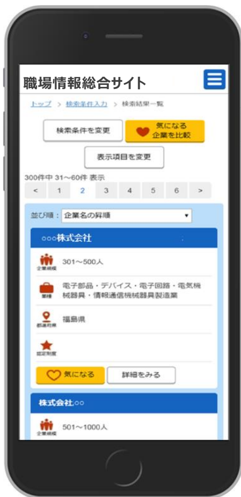
検索結果一覧画面